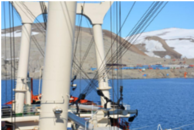
La ricerca tra i ghiacci del Polo Sud, diario della XXXI spedizione italiana