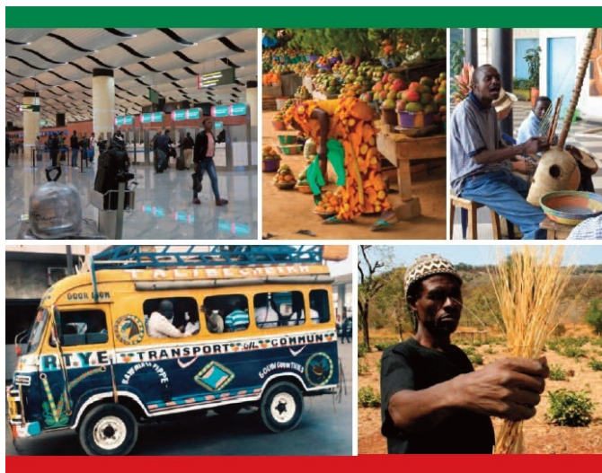
Uno studio sulle migrazioni tra Italia e Senegal realizzato nell’ambito del progetto CREA

Per molti anni la migrazione è stata uno dei temi più dibattuti nell’opinione pubblica europea, ma anche uno dei temi più “caldi” che oggi i governi devono affrontare e che minaccia di rimettere in discussione i fondamenti della convivenza. Vista dal lato meridionale del Mediterraneo, la migrazione è un fenomeno complesso e ambivalente, perché porta ricchezza e morte, ed è intimamente legata al deterioramento dell’ambiente e alle condizioni di vita di molti Paesi nel Sud del mondo. Lo studio “Partire e ritornare”, scritto dal Centro Studi e Ricerche IDOS di Roma, è il risultato di una ricerca che fa parte del progetto di cooperazione internazionale di Green Cross Italia denominato CREA (Création d’Emplois dans l’Agriculture), cofinanziato dal Ministero dell’Interno italiano con l’obiettivo principale di sostenere lo sviluppo locale, la creazione di posti di lavoro e, di conseguenza, diminuire la propensione a emigrare da parte dei giovani senegalesi.