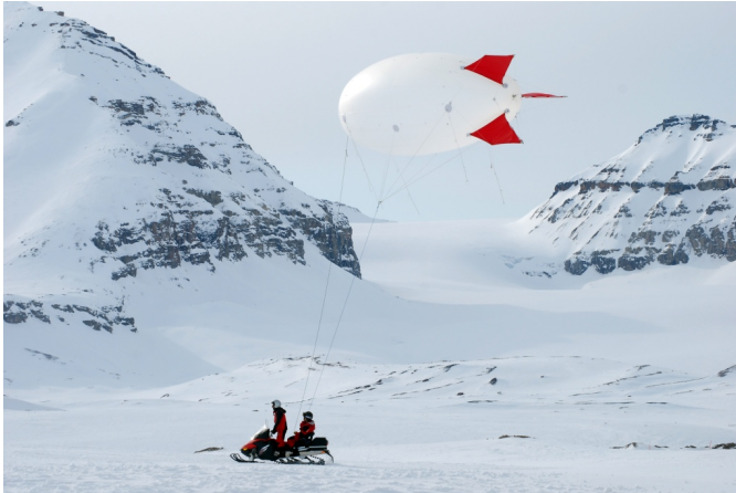
Green Cross e CNR spiegano ai bambini le sfide della scienza

Grandi palloni, dotati di particolari sensori, eseguono osservazioni nello strato dell'atmosfera più vicino alla superficie terrestre, chiamato strato limite. Dalle Isole Svalbard, oltre l'80° parallelo Nord